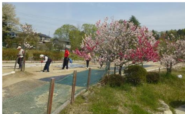
▲マレットゴルフ大会

今年が初めての開催で花桃はいっぱいとは言えませんが、沢山の 苗を植樹したので来年、2年後、3年後がとても楽しみです。 みなさん、来年見に来て下さいね。(主催:藤岡石畳地区地域づくり協議会)